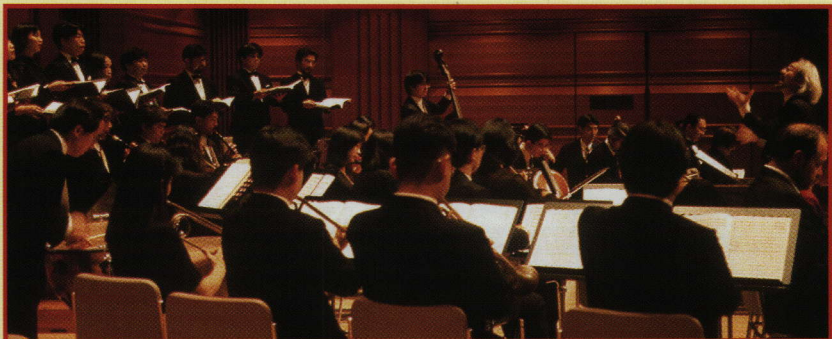
Bach Collegium Japan / Masaaki Suzuki